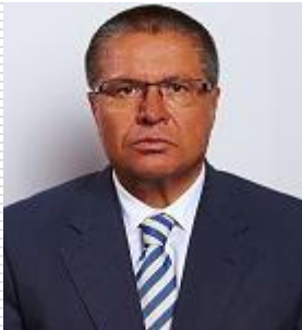
Alexeï Ouliukaïev, Ministre du développement économique de la Russie